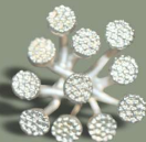
groß 10-11 dolden